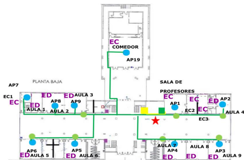
Vista en planta de la Planta Baja de la sede con la solución WIFI instalada en el centro